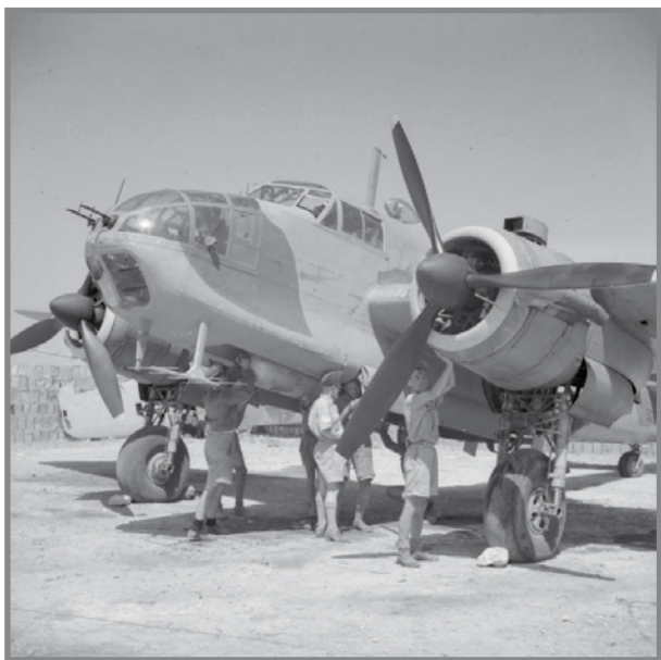
Beaufort ta' 217 Squadron f' Malta

Izda ftit jafu li f'wieħed mill-ewwel hijacks li sar ukoll kienet involuta Malta. Kienet is-sena 1942, fl-eqqel tal-Gwerra. Ajruplani Ingliżi kienu ta' kuljum joħorġu jattakkaw bastimenti Taljani u Ġermaniżi. U hekk ġara fit-28 ta' Lulju 1942. Beauforts ( bombers Ingliżi) ta' 217 Squadron, armati b' torpedoes , sabu xi bastimenti Taljani ftit 'il barra mill-kosta tal-Greċja. Il-Beauforts ittajru fil-baxx, ftit metri 'il fuq minn wiċċ il-baħar, biex jitolqu t- torpedoes