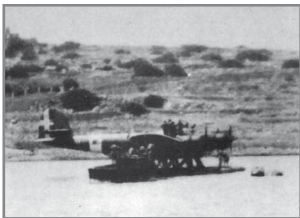
Cant-Z 506B fil-bajja tax-Xemxija. Fuq jidhru kemm l-ekwipaġġ Taljan kif ukoll l-Ingliżi li ħatfuh.

Fl-ajruplan ma kien hemm l-ebda mapep allura l-Ingliżi ma kinux ċerti fejn qegħdin eżatt! Wara ffit dehret l-art fuq ix-xefaq u Strever induna li kienet il-kosta Taljana. Allura l-ajruplan dar lejn in-nofsinar u bdew jittamaw li tfigg il-kosta Maltija qabel jispiċċaw bla fuel . Izda l-inkwiet tagħhom kien għadu bilkemm beda!