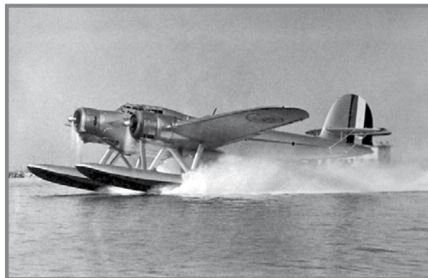
Cant-Z 506B Taljan ser jinqata' minn fuq l-ilma

Wara xi sigħat jippruvaw jaqdfu lejn l-art dehret tikka sewda fis-sema. Kien seaplane Taljan li hekk kif rahom dlonk niżel fuq l-ilma. Strever u shaħu qadfu lejn l-ajruplan u spicċaw prigionieri. L-ajruplan ħadhom fuq gżira fil-qrib u hemm it-Taljani laqgħuhom b'ospitalità kbira, tawhom ikla tajba filwaqt li ħallewhom jużaw il-kamra tal-ikel tal-uffiċjali tagħhom. Filgħodu pprovdewlhom kolazzjon u, wara ritratt tal-okkażjoni, rikbu fuq seaplane Taljan Cant-Z biex jittieħdu lejn Taranto l-Italja u minn hemm għal go kamp tal-prigionieri. 2